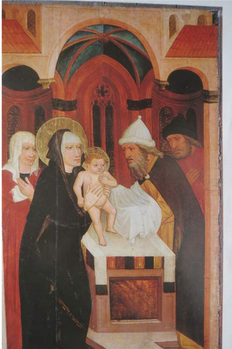
Meister der Darbringung, Wien 1420/40, ex coll. Herbert Douteil

Zum 5. Februar, dem Fest der heiligen Agatha: